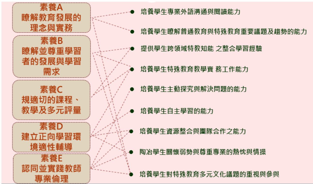
圖1-2-1(1) 特教系教育目標與教師專業素養之對應。